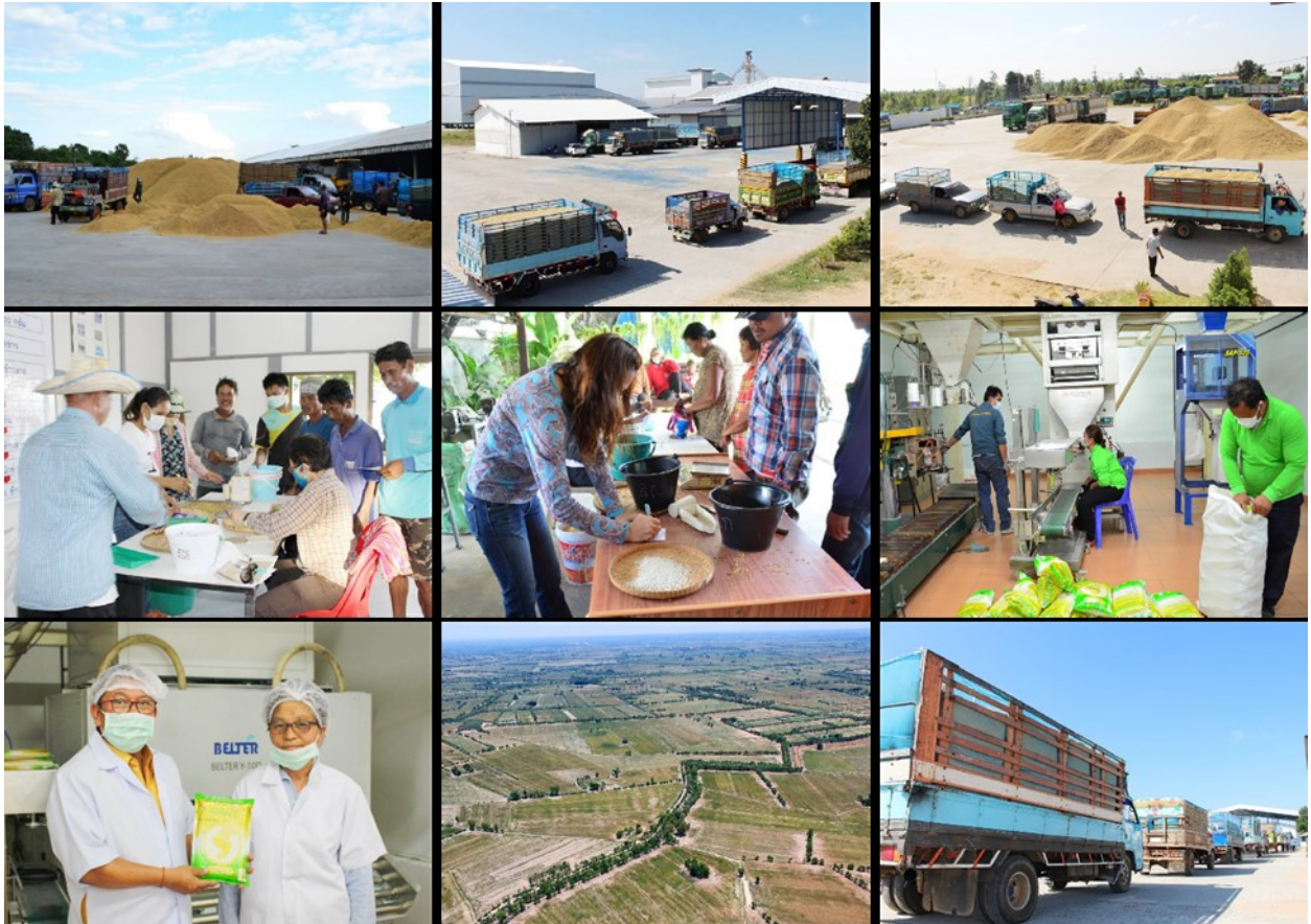
การส่งเสริมการจำหน่ายข้าวหอมมะลิ สหกรณ์การเกษตรวิสัย จำกัด